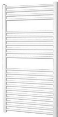
Designradiator: Plieger Palermo