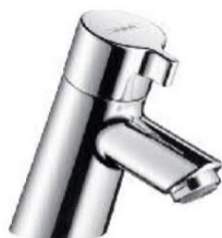
Fontein kraan: Grohe Focus S