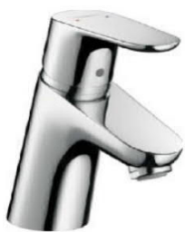
Wastafelkraan: Grohe Focus E2