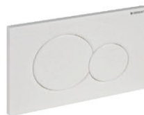
Bedieningsplaat: Wit kunststof