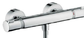
Douchekraan: Grohe Ecostat Comfort